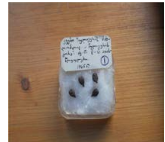
Figura 15. Semillas cultivadas procedentes de Shulaveri Gora, con una antigüedad de 8.000 años. Museo Arqueológico de Tbilisi.

Lógicamente, en aquella época los grupos humanos desconocían la sexualidad de las parras silvestres, pero seleccionaron las hermafroditas, aparecidas por mutación de algunos ejemplares masculinos, ya que al poseer autofecundación tenían un mayor nivel de cosecha.