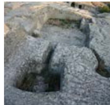
Figura 17. Lagar rupestre de Uplistsikhe

Los análisis químicos de compuestos orgánicos antiguos absorbidos en la cerámica de yacimientos de Georgia, en la región del Cáucaso Sur (Shulaveri Gora y Gadachrilli) brindan la evidencia arqueológica biomolecular más temprana para el vino de uva y la vitivinicultura (McGovern et al., 2017). En ellos se han encontrado restos de bitartratos, ácido tartárico, málico, cítrico y succínico en el interior de los fragmentos de dicho tipo de cerámica, así como con la evidencia arqueobotánica de polen de uva, almidón y restos epidérmicos asociados. Todo ello revela su uso como contenedores vínicos. Los procesos de restauración han revelado que su morfología era bastante similar a los de las actuales vasijas de fermentación, llamadas quevri, que tuvieron