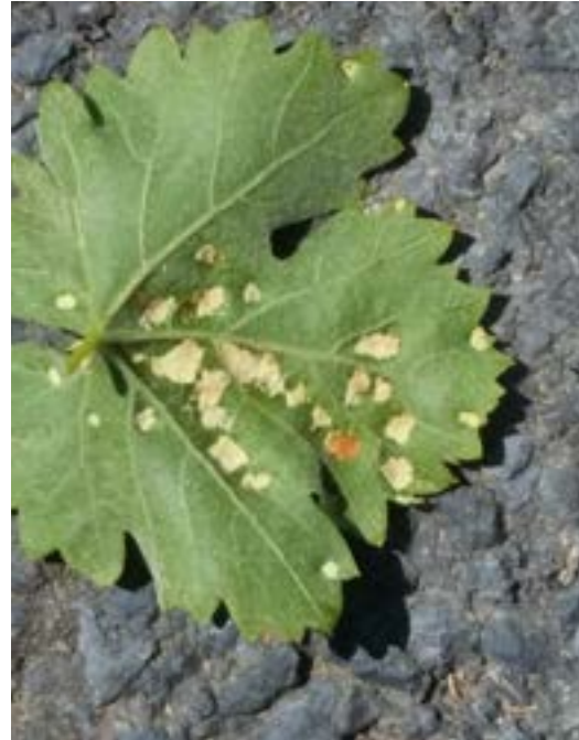
Figura 2. Síntomas de erinosis en el envés de una hoja

Otros relictos terciarios, que suelen coincidir en los mismos hábitats de la vid silvestre en la región, son Crataegus monogyna subsp. curvisepala , Morus alba , Smilax excelsa , Pterocarya fraxinifolia , y Quercus