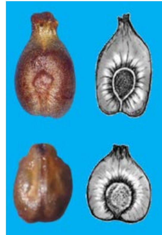
Figura 14. Diferencias morfológicas entre semillas cultivadas y silvestres