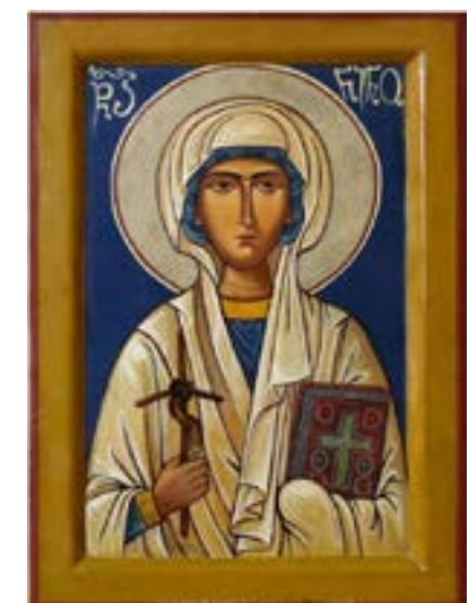
Figura 12. Icono de Sta. Nino portando la cruz hecha con sarmientos