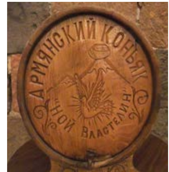
Figura 11. Cubeta de la bodega anterior en la que se representa el Arca sobre el Monte Ararat. La inscripción en ruso dice : Noé, señor supremo