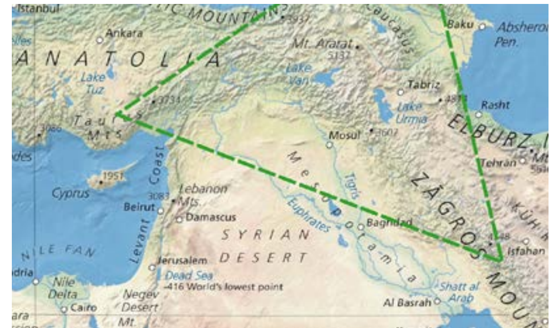
Figura 7. Triángulo de la Uva Fértil de Vavílov

Vavílov emprendió personalmente numerosas expediciones y organizó muchas otras más, cuyo resultado, entre otras cosas, fue la creación del mayor banco de germoplasma de plantas cultivadas del