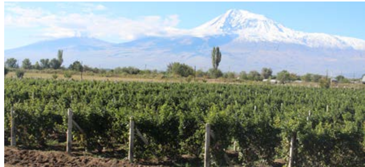
Figura 9. Viñedo armenio con el Monte Ararat al fondo

No sabemos quién escribió esos relatos bíblicos, pero sí está claro que conocía la gran diversidad de vides, tanto silvestres como cultivadas, que poblaban y aún se conservan en la región. De hecho, dentro del citado Triángulo de la Uva Fértil de Vavílov, que alberga la máxima diversidad de la vid, el Monte Ararat se encuentra en la zona central del mismo. Según la tradición ortodoxa, Santa Nino introdujo el cristianismo en Georgia en el s. IV. Era una joven que procedía de La Capadocia (actual Turquía). Venía acompañada de sus padres y portaba una cruz formada por dos fragmentos de tronco de vid fijados entre sí con sus propios cabellos. En la catedral de Tbilisi puede contemplarse la posible reliquia. De hecho, su imagen se encuentra en la práctica totalidad de las iglesias de país.