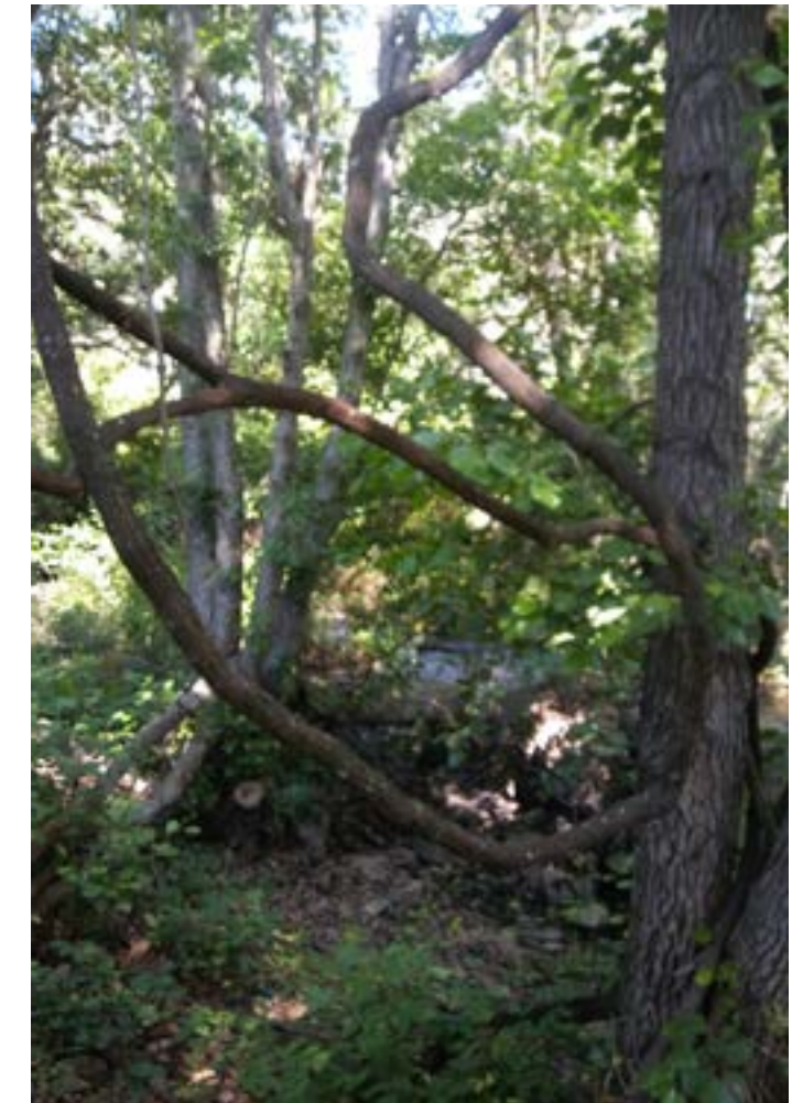
Figura 1. Parras silvestres en el bosque de ribera del Guruchai (Azerbaiyán)

Esta región, a caballo entre Europa y Asia, por donde discurría un tramo de la Ruta de la Seda y formó parte de la URSS, ha tenido, por su posición estratégica varios conflictos bélicos. Entre los más recientes del presente siglo se encuentran la ocupación de Ossetia del Sur y Adjasia, puerta del mar Negro, por las tropas rusas, que continúa en la actualidad. Y, también, el enfrentamiento entre Armenia y Azerbaiyán por el territorio de Nagorno Karabaj.