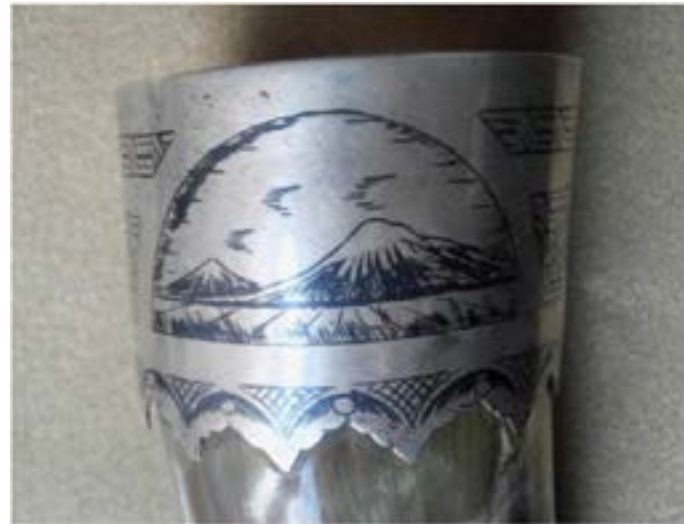
Figura 25. Vaso de cuerno vacuno con el Monte Ararat grabado en plata (Armenia)