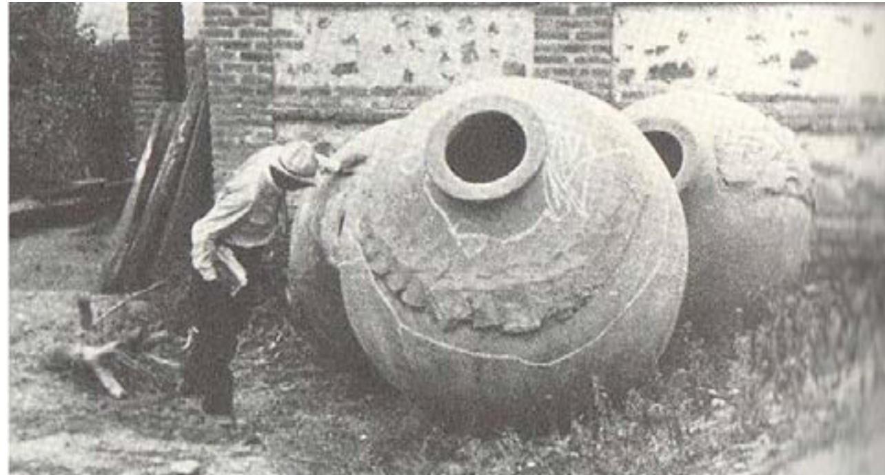
Figura 20. Fotografía de Vavilov junto a quevris.