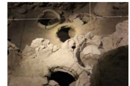
Figura 19. Recipientes para vino de la Cueva de Areni 1 (Armenia)

para la fermentación y almacenamiento de vino, tinajas, e incluso vasos cerámicos para beber (Wilkinson et al., 2012). Se encontraron también semillas con índices morfométricos intermedios entre silvestres y cultivadas y restos de racimos. Por su parte, el análisis químico de las tinajas mostró la presencia de residuos de vino, como los ya indicados en el caso de los proto-quevris, y, también, trazas de malvidina, un pigmento de uva propio de vinos rosados y tintos (Wilkinson, 2012; Smith et al., 2014).