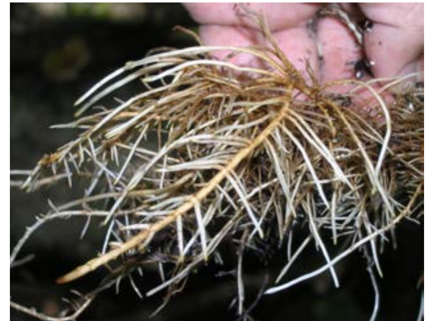
Figura 5. Pelos absorbentes carentes de síntomas de filoxera y de micelios de podredumbre radicular

zadas como portainjertos, probablemente han reducido bastante el número de parras que se conservan en cada población (Ocete et al., 2012; Maghradze et al., 2012). Por ello, seguramente, ya no se encuentran aquellos monumentales ejemplares de gran antigüedad que, según Pallas (1799-1801), científico alemán que trabajó para la emperatriz Catalina La Grande de Rusia, llegaban a tener “dimensiones de tronco similares a mástiles de barco”. No se han apreciado en ningún ejemplar de Armenia, Azerbaiyan y Georgia síntomas causados por el virus del entrenudo corto (Grape fanleaf virus, GFLV). A nivel de los pelos absorbentes de la raíz, hay que destacar que en ningún caso se