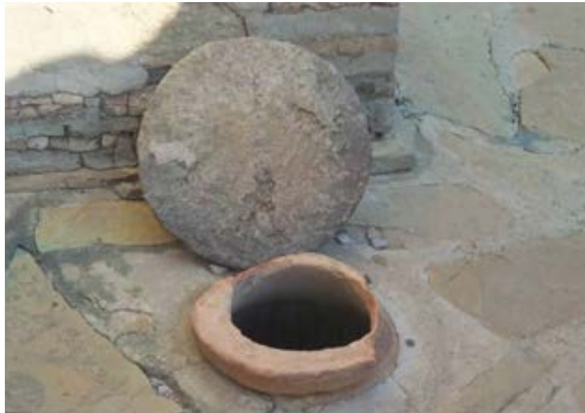
Figura 23. Tapadera de piedra que se sella a la tinaja con una pasta de arcilla mojada.