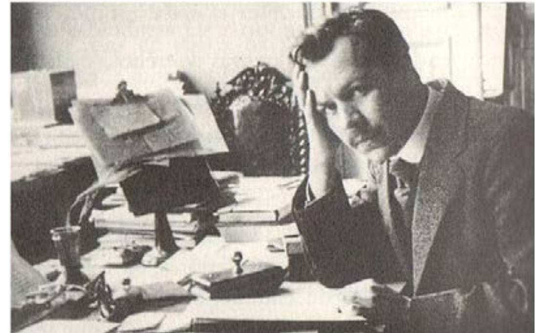
Figura 8. Vavílov en su despacho de San Petersburgo.

Lo que vio le impactó mucho. «España resultó un país realmente interesante para entender la agricultura europea», escribe. En aquella época el mundo rural era absolutamente diferente del actual y las particularidades locales mucho más marcadas que ahora, que casi no existen. A Vavílov le llamaron la atención algunos cultivos endémicos (o casi), como las afreitas o avenas negras de Galicia (avenas diploides), singulares especies de leguminosas entonces muy cultivadas como la algarroba ( Vicia articulata ) o el alberjón ( Vicia narbonensis ), el tojo ( Ulex europaeus ) cultivado como planta forrajera en Galicia y la espelta asturiana, entre otras. Señaló también el interés que tenían las variedades de leguminosas de semilla grande que había encontrado, sobre todo garbanzos, habas y almortas, el variado surtido de trigos (hoy prácticamente desaparecido), las variedades de hortalizas de tamaño excepcional y una muy interesante diversidad de árboles