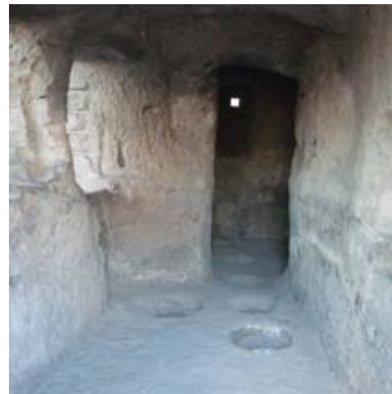
Figura 18. Bodega excavada en la roca. Pueden verse los hoyos para albergar los quevris.

mucho mayor volumen, hasta unos 8.000 L. (Paadín y Paadín, 2019).