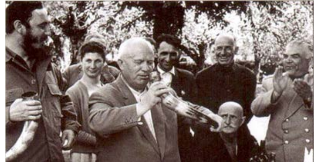
Figura 26. Nikita Khrushchev, el que fuera presidente de la URSS, con Fidel Castro en una visita a Georgia. Mercadillo de antigüedades de Tbilisi