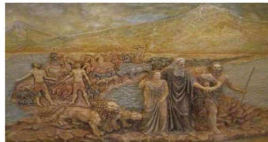
Figura 10. Decoración del interior de la Bodega Noy (Ereván), en la que se representa la salida del Arca