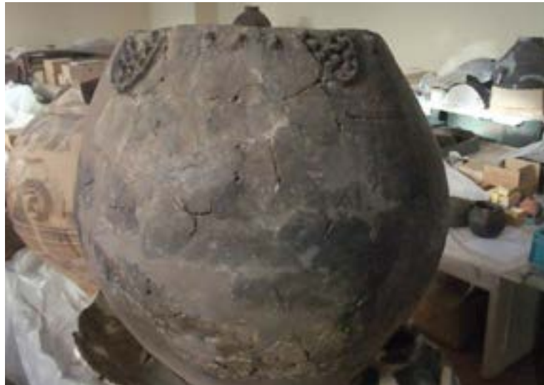
Figura 16. Quevri primitivo. Su decoración imita racimos de uva. Museo Arqueológico de Tbilisi

Los análisis químicos de compuestos orgánicos antiguos absorbidos en la cerámica de yacimientos de Georgia, en la región del Cáucaso Sur (Shulaveri Gora y Gadachrilli) brindan la evidencia arqueológica biomolecular más temprana para el vino de uva y la vitivinicultura (McGovern et al., 2017). En ellos se han encontrado restos de bitartratos, ácido tartárico, málico, cítrico y succínico en el interior de los fragmentos de dicho tipo de cerámica, así como con la evidencia arqueobotánica de polen de uva, almidón y restos epidérmicos asociados. Todo ello revela su uso como contenedores vínicos. Los procesos de restauración han revelado que su morfología era bastante similar a los de las actuales vasijas de fermentación, llamadas quevri, que tuvieron