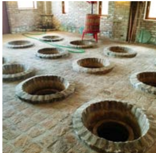
Figura 22. Interior de una bodega (mariani), donde se aprecian las bocas de los quevris

que se suele fijar a la boca de la tinaja con barro arcilloso. En primavera, normalmente en marzo o abril, de destapan y el vino se trasiega a otro quevri limpio. Cuando el proceso de crianza ha llegado a su fin, el vino no se suele someter a un enfriamiento y filtrado exhaustivo (Paadín y Paadín, 2019).