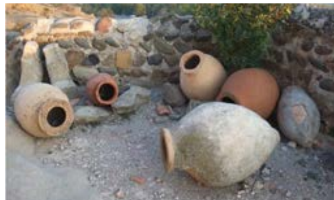
Figura 21. Conjunto de quevris

En los últimos años, este tipo de vino ha polarizado la atención internacional de enólogos, importadores, sumilleres, consumidores y periodistas. A ello ha contribuido decisivamente su reconocimiento como Patrimonio Cultural Inmaterial de la Humanidad desde 2014. Su sistema de producción, con ciertas similitudes al del conocido como vinho de talha (vino de tinaja) del sur de O Alentejo (Portugal), se ha copiado en varios países europeos.