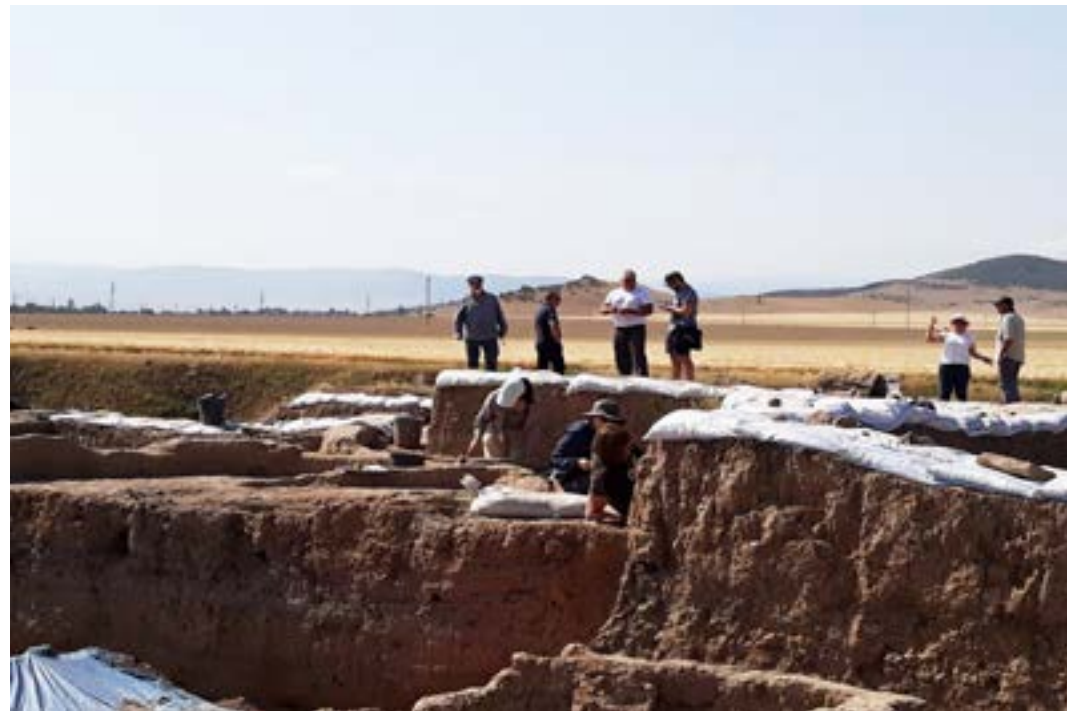
Figura 13. Excavación en el tell de Shulaveri Gora (Georgia)

fueron descubiertas por investigadores soviéticos en las campañas de excavación acaecidas durante la década de 1960 (Mc Govern, 2003 y 2004; Chilashvili, 2004), en las que las catas palinológicas revelaron, también, la presencia de abundantes granos de polen tricorporado.