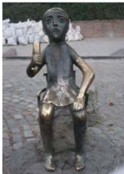
Figura 24. Tamada